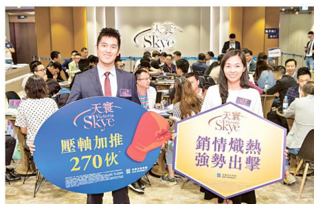
2017/06/05 (週一) 12:00 上午

美聯的數據亦顯示，周末 10 大屋苑成交僅錄 4 宗，按周跌 50%，創 17 周新低。美聯住宅部行政總裁布少明認為，金管局收緊按揭及銀行加息對樓市衝擊有限，新盤銷售熾熱，在新盤主導市場下，二手成交受壓，將繼續於低位徘徊。