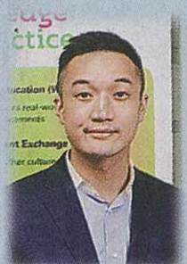
▲羅建一希望通過比賽喚起理大學生及公眾關注九龍東未來發展